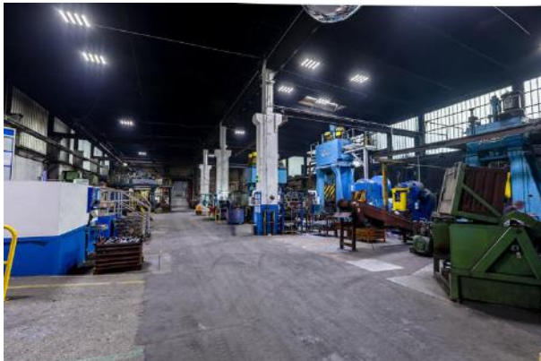
Die 3-flammigen Industrie Hallenstrahler erleuchten die Fertigungshalle

Bei Veröffentlichung freuen wir uns über Ihr kurzes Signal oder einen Beleg – vielen Dank!